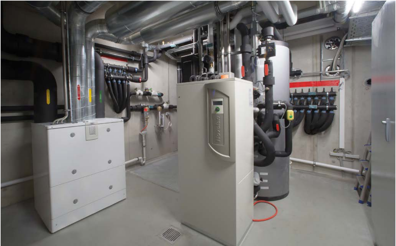
Der Technikraum des Wohnhauses ist die Schaltzentrale für intelligent vernetzte Energiesysteme. Das Vallox-Lüftungsgerät für die kontrollierte Wohnungslüftung (links) erzielt durch einen Kreuz-Gegenstrom-Wärmetauscher einen Wärmerückgewinnungsgrad bis 90 %. Die Wärmepumpe (Mitte) nutzt das thermisch aktive Kiesbett unter dem Fundament als Wärmequelle.

für stets frische Luft zu sorgen – auch dann, wenn sich das Planer-Ehepaar gerade außerhalb des Hauses um die laufenden Bauprojekte kümmert.