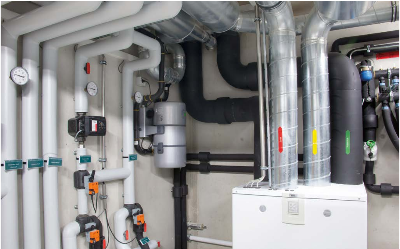
Während der frostschutzmittelfrei betriebene Kreislauf des Erdwärmekollektors im Sommer durch eine einfache Dreiweg-Umschaltung (links) für die Flächenkühlung genutzt werden kann, sorgen das Komfortlüftungssystem (rechts) und die Zentralstaubsauganlage (Mitte) für frische und hygienische Luft.